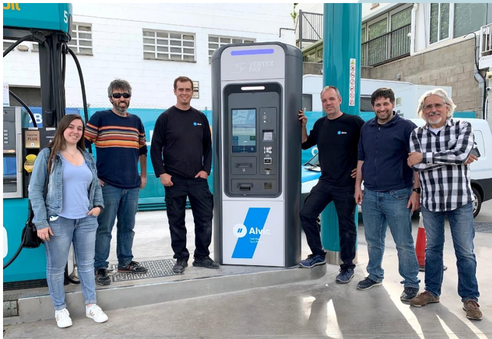
Foto: En abril se realizó la instalación del primer Vertex en la estación de servicio Autonetoil de Alella (Cataluña).

Servicomput, S.A.U. Polígono Industrial Congost Avda. Forn de la Calç, 3 08540 Centelles (Barcelona)