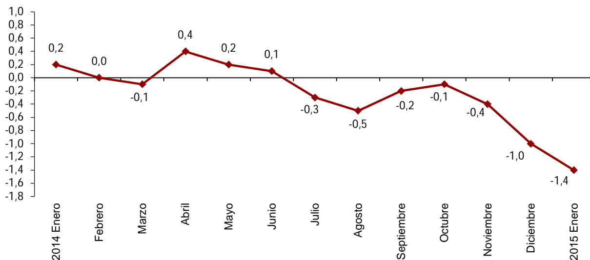
Evolución anual del IPC, base 2011 (1) Índice General

(1) El último dato se refiere al indicador adelantado